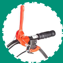
LEVERAGES traction + engagement de l'outil avec système de sécurité intégré