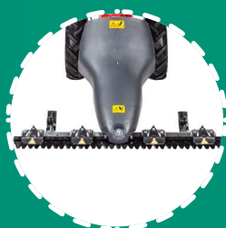
MOUVEMENT BI-LAME deux lames oscillantes coupe 87 cm