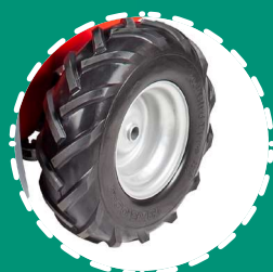
ROUES MOTRICES anti-crevaison 13x5.00-6"