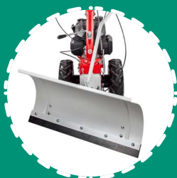
LAME NEIGE 85 cm orientable \pm 30^\circ