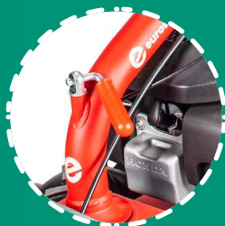
GUIDON RÉGLABLE verticalement et latéralement