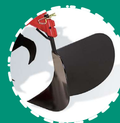
RINCALZATORE ad ali fisse