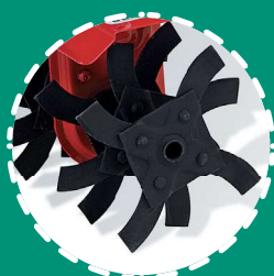
SCARIFICATORE a lame, 30 cm