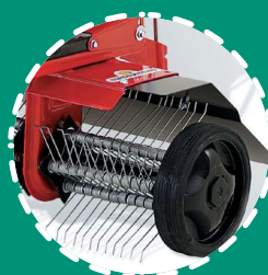
ARIEGGIATORE a molle, 50 cm