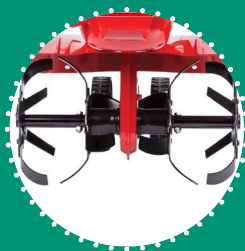
FRESA coltelli rivettati Ø26 cm 40 cm