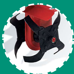
RIDUZIONE FRESA larghezza 16 cm