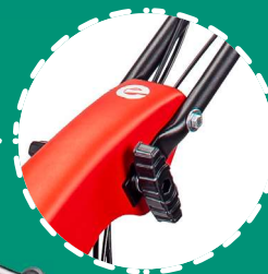
MANUBRIO registrabile in altezza